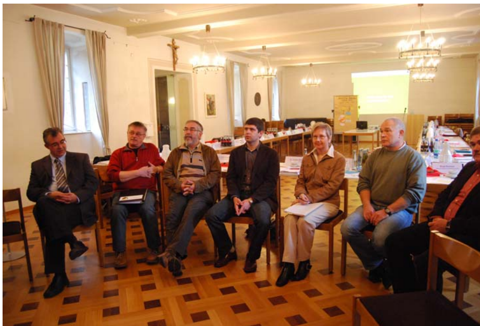
Arbeit in Kleingruppen während der 3. PAG-Sitzung am 10. Dezember 2010

In der 3. Sitzung der Projektbegleitenden Arbeitsgruppe (PAG) am 10. Dezember 2009 wurde die Konzeption des Moderationsverfahrens und der geplanten Veranstaltungen, zur Information der Öffentlichkeit vor Ort, vorgestellt und in Kleingruppen diskutiert. In den Kleingruppen wurden viele wichtige Hinweise für die Konzeption und den zu wählenden Zeitpunkt der Veranstaltungen gegeben. Im Folgenden wird dargestellt, wie die Anregungen umgesetzt wurden.